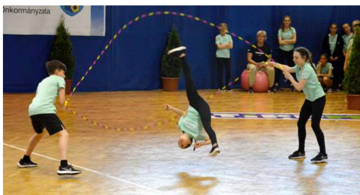
Panna akcióban: akrobatikus versenysport ez a javából

Mire biztathatnánk az olvasót, ha nem arra, hogy forduljanak érdeklődéssel ezen sport irányába, s ha tehetik, támogassák – akár magánemberként, akár cégként – a Maklári Bosch Kötélugró Klubot