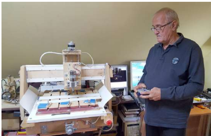
Saját tervezésű és gyártású NC gépe, lent a 3D nyomtató

Van egy érdekes története Demjén múltjából, vagy jelenéből? Szívesen megosztana egy régi családi történetet, mely a településhez kapcsolódik? Netán a régi történetekhez, régi fényképek is társulnak? Szívesen megosztaná ezeket Demjén lakosaival? Ha igen, akkor vegye fel velünk a kapcsolatot a Művelődési Házban személyesen, vagy telefonon, a 793-179-as számon.