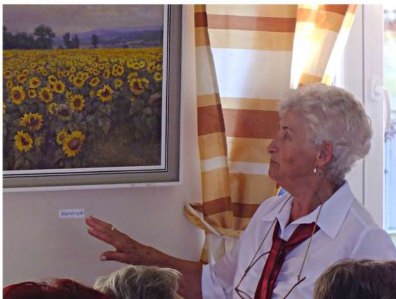
Kiállítás megnyitó aktív résztvevőjeként

Van egy érdekes története Demjén múltjából, vagy jelenéből? Szívesen megosztana egy régi családi történetet, mely a településhez kapcsolódik? Netán a régi történetekhez, régi fényképek is társulnak? Szívesen megosztaná ezeket Demjén lakosaival? Ha igen, akkor vegye fel velünk a kapcsolatot a Művelődési Házban személyesen, vagy telefonon, a 793-179-as számon.